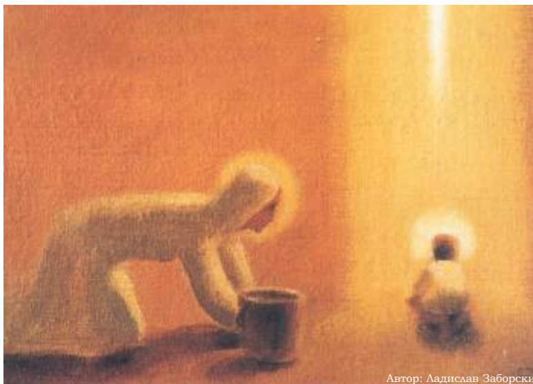
Автор: Ладислав Заборски